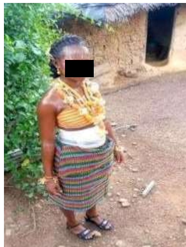
Photo 8 : nouvelle mère Baoulé le jour de la sortie

Chez les Baoulé d'Ayaou-Sran (photo 8), la sortie intervient après une semaine de réclusion, deux semaines pour la mère de jumeaux. La cérémonie se déroule en trois temps : le baptême traditionnel du nouveau-né, la libation faite par le père ou un oncle, puis la sortie de la mère et de l'enfant habillés spécialement pour la circonstance. Une différence notable distingue les Baoulé des Ébrié : chez les Baoulé, c'est l'enfant qui est au centre du rituel, plutôt que la mère. La cérémonie célèbre l'arrivée du nouveau membre de la communauté. Précisons que la célébration n'est organisée que par les familles qui en ont les moyens.