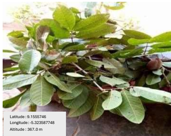
Photo 1: prosopis africana utilisé pour les soins des nouvelles accouchées à Napiéleodougou

Le rite y est le plus court, limité à seulement 4 jours. La réclusion est purement symbolique et centrée sur la protection spirituelle contre les forces maléfiques. L'accent est mis sur la guérison physique et la purification simple à l'aide de plantes médicinales locales traditionnellement prisées par les Sénoufo. Le but est le rétablissement rapide de la capacité de travail de la femme, pilier agricole de la société. La photo 1 montre la plante dont les feuilles sont utilisées pour les soins des nouvelles accouchées à Napiéleodougou.