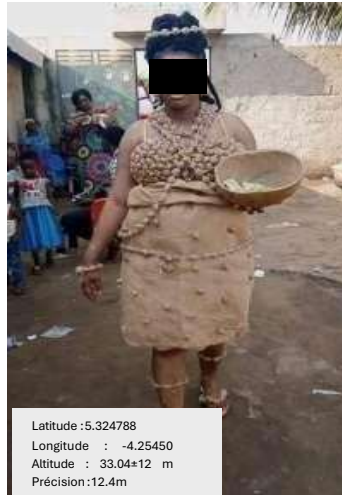
Photo7: nouvelle mère Ebrié le jour de sa sortie

Cette image concentre la conception Ébrié du post-partum. Le corps de la mère, arrondi après trois mois de soins et d'alimentation riche en matière grasse, devient lui-même un message adressé à la communauté : sa famille l'a bien prise en charge. Ses tenues, entièrement confectionnés à partir des produits de la terre, fibres de raphia, graines, légumes, bout de tissus, fil de fer, traduisent l'inventivité et la fierté culturelle des Ébrié. Chaque matière utilisée est une profession de foi : la terre nourrit la femme, la femme nourrit la vie.