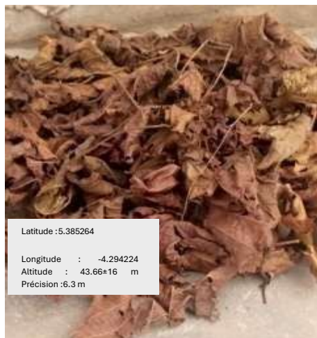
Photo 3 : alchornea cordifolia à Songon

Ici que le rite est plus contraignant pour la nouvelle mère, pouvant durer jusqu'à 90 jours. La réclusion vise une transformation physique. La mère doit gagner du poids pour symboliser la richesse et les bienfaits de la maternité. Lors de la sortie, la mère transformée physiquement doit être célébrée de façon spéciale, spectaculaire, vêtue de pagnes de haute valeur, parée de bijoux traditionnels aux poignets et aux chevilles et chaussée de sandales de grandes valeurs.