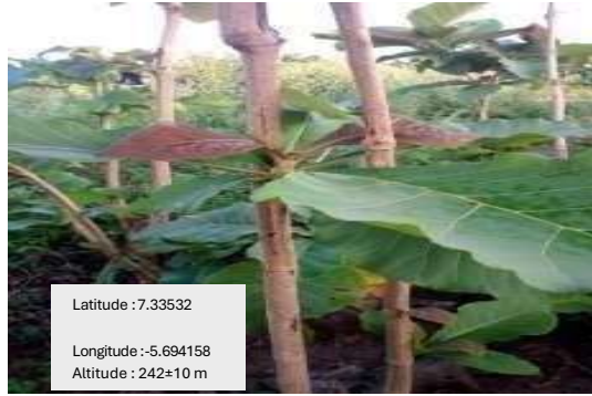
Photo 2 : tektona grandis à Ayaou sran

Si la nouvelle mère présente des signes de fièvre et vomit, on ajoutera un bout de canari cassé aux décoctions qu'elle doit utiliser pour se purger. Les feuilles de teck, jugées stimulantes et contribuant à régénérer le sang perdu lors de l'accouchement, luttant contre l'anémie et la fièvre, sont très utilisées.