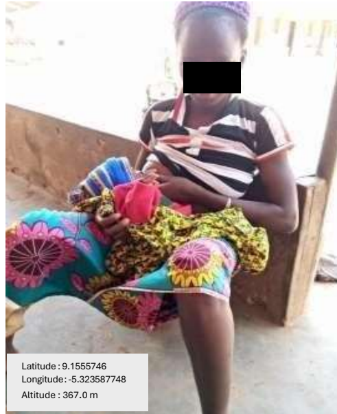
Photo 6: nouvelle mère Sénoufo le jour de sa sortie

Chez les Sénoufo de Napiéléodougou, la sortie (photo 6) est sobre mais chargée de sens. Elle survient quand le nombril de l'enfant se détache, signe que la fragilité des premiers jours est passée. On rase la tête de l'enfant pour le protéger du mauvais regard. Alors que les animistes confient le nouveau-né au chef du village et ensuite au fétiche protecteur du village, chez les chrétiens, on le présente à l'église où il reçoit la bénédiction. Quant aux musulmans, ils font une cérémonie de baptême après l'accouchement.