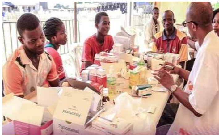
Photo 06 : Dons de médicaments aux patients lors d'une croisade des églises Vases d'Honneur