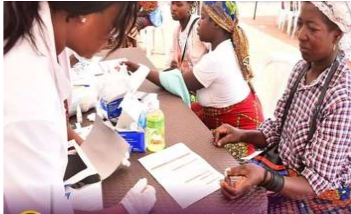
Photo 05 : Consultation gratuite lors d'une croisade des églises Vases d'Honneur Cliché : YAO Adou, Juillet 2021

consolide son ancrage dans la ville d'Abidjan et dans les villes de l'intérieur du pays tout en renforçant une légitimité sociale. Les œuvres sociales apparaissent dès lors comme un levier d'expansion territoriale de cette église. Les figures 5 et 6 présentent respectivement une activité de consultation médicale gratuite et une opération de distribution gratuite de médicaments.