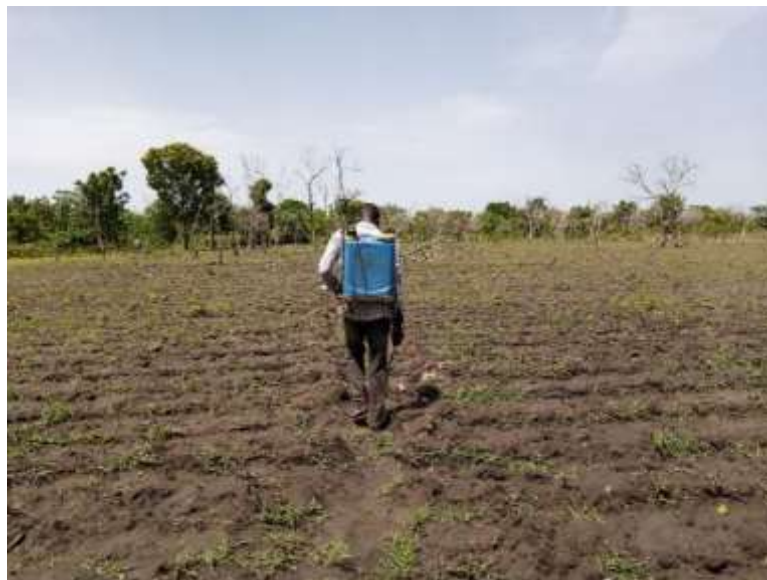
Photo 2 : Opération d'épandage d'herbicide après semis Prise de vue : N. Dovonou, mai 2024

Le SP 3 est un système de production à but commercial, dominé le plus souvent par la culture du coton. Il englobe les grands producteurs de l'or blanc et de maïs qui utilisent les tracteurs et autres engins agricoles avec une tendance à la mécanisation. Ce système est caractérisé par la forte utilisation d'engrais chimiques et orienté vers la maximisation des rendements ainsi que l'efficacité économique de l'exploitation agricole. Les producteurs dans ce système négligent toute stratégie de conservation de l'environnement. Ce système exige l'utilisation de produits chimiques et de pesticides qui ont des effets néfastes sur le sol, sa vie biologique et sur la qualité de la végétation. Le SP 3 expose le sol à l'érosion aussi bien hydrique qu'éolienne, plus que les autres.