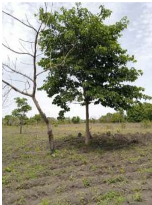
Photo 1 : Milicia excelsa préservée dans un champ à Monsourou, Commune de Djidja

Les espèces comme l'iroko ( Milicia excelsa ) et le baobab ( Adansonia digitata ) sont maintenues sur ces exploitations, car faisant partie des espèces sacrées (Photo 1). La Commune de Djidja reste marquée par la croyance aux arbres "fétiches" ou dits sacrés. Aussi, les espèces à valeur économique comme Parkia biglobosa , Vititex doniana , Azadirachta indica , Mangifera indica sont-elles conservées dans ce système de production.